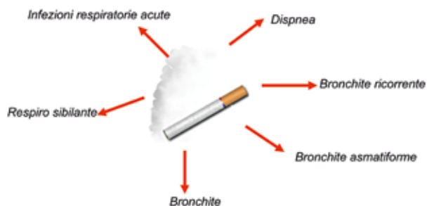
Fig. 1. Effetti negativi sulla salute respiratoria da esposizione al fumo in gravidanza e in epoca postnatale

dispnea (OR = 1,8), bronchite (OR = 2,1), bronchite asmatiforme (OR = 1,8). Se consideriamo soltanto la condizione di esposizione postnatale, essa costituisce un fattore di rischio significativo per bronchite ricorrente (OR = 1,4) e infezioni respiratorie, specialmente quelle acute (OR = 3,39) 1-3 (Fig. 1).